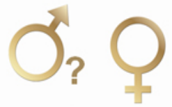
Abbildung 1: Geschlechterunterschiede bei PSI4 werden im höheren Alter signifikant. (nach C. Gleissner, 2014)

Abbildung 1 zeigt den hochsignifikanten Unterschied zwischen Männern und Frauen hinsichtlich einer schweren Form der Parodontitis (PSI4). Männer weisen besonders im höheren Lebensalter (65-74) deutlich häufiger eine schwere Form der Parodontitis auf als Frauen.